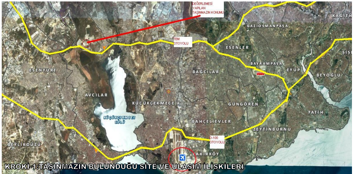
KROKİ-1: TAŞINMAZIN BULUNDUĞU SİTE VE ULAŞIM İLİSKİLERİ

Değerlemesi yapılan taşınmaza TEM Otoyolu üzerinden İspartakule Mevkii'nden ulaşılabilir. Ulaşım TEM Otoyolu üzerinden özel araçlar vasıtası ile sağlanmaktadır. Toplu ulaşım açısından yetersiz bir konumdur.